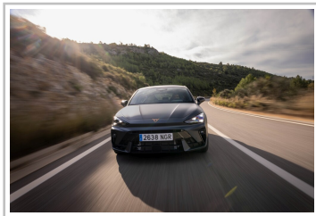
Cupra Leon VZ.