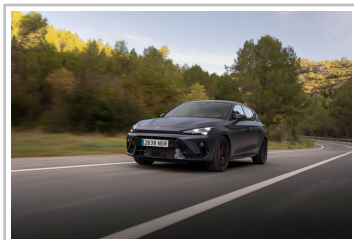
Cupra Leon VZ.