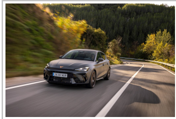
Cupra Leon VZ.