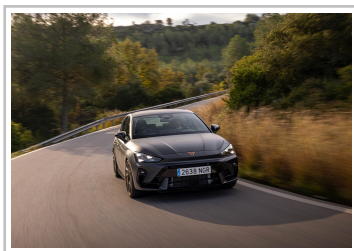
Cupra Leon VZ.