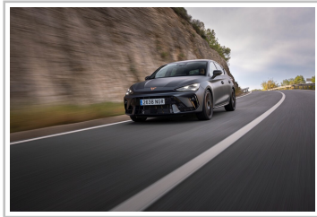
Cupra Leon VZ.