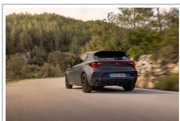
Cupra Leon VZ.