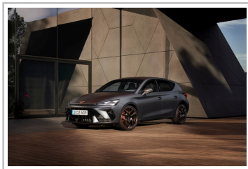
Cupra Leon VZ.