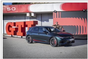
Volkswagen Golf GTI Edition 50.