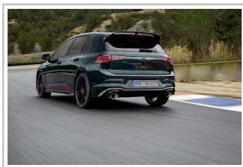
Volkswagen Golf GTI Edition 50.