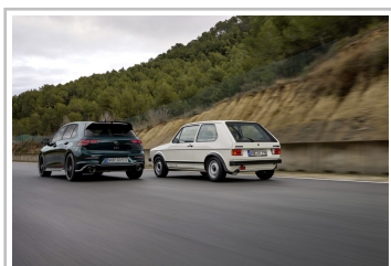
Volkswagen Golf GTI Edition 50 und der Ur-GTI.