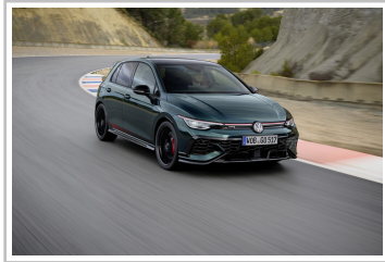
Volkswagen Golf GTI Edition 50.