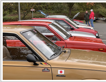
Toyota Collection Klein- und Kompaktwagen.