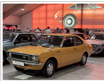
Toyota Collection Klein- und Kompaktwagen.