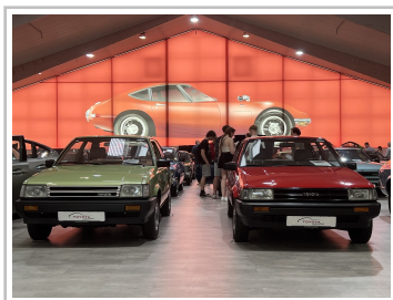
Toyota Collection Klein- und Kompaktwagen.