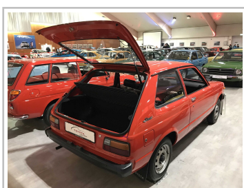
Toyota Collection Klein- und Kompaktwagen.