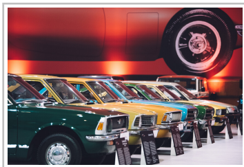
Toyota Collection Klein- und Kompaktwagen.