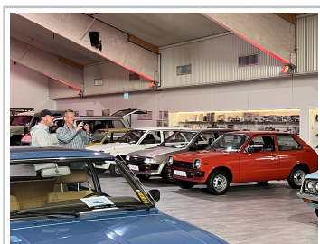
Toyota Collection Klein- und Kompaktwagen.