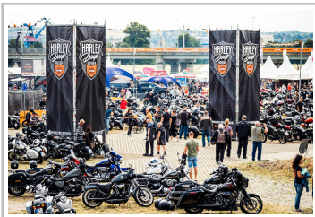
Harley Days Dresden.