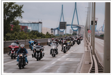
Harley Days Hamburg.