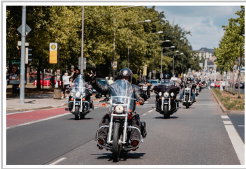
Harley Days Dresden.