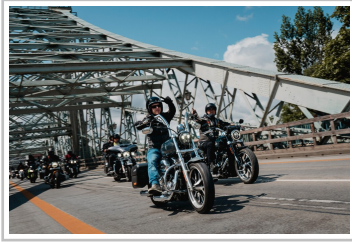
Harley Days Dresden.