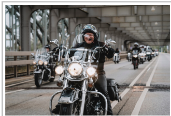
Harley Days Hamburg.