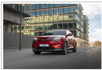
Vinfast VF 8.