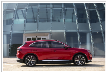
Vinfast VF 8.