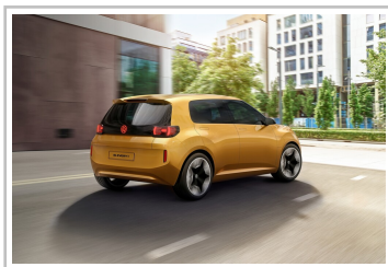
VW ID Every 1.