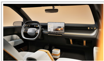
VW ID Every 1.