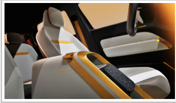
VW ID Every 1.