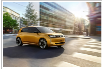
VW ID Every 1.