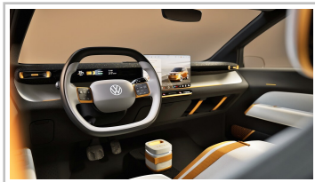
VW ID Every 1.