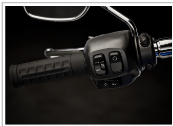
Harley-Davidson Fat Boy.