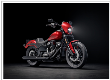
Harley-Davidson Low Rider S.