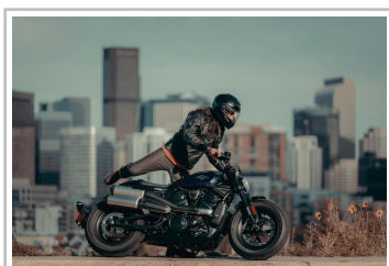
Harley-Davidson Sportster S.