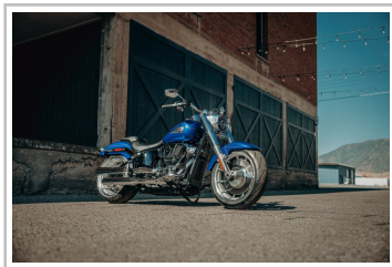
Harley-Davidson Fat Boy.