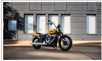
Harley-Davidson Street Bob.