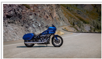
Harley-Davidson Low Rider ST.