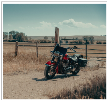
Harley-Davidson Heritage Classic.