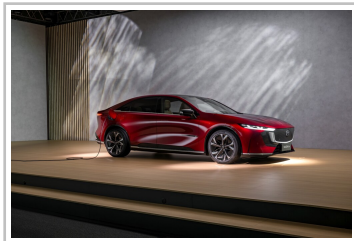
Mazda 6 e.