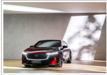
Mazda 6 e.