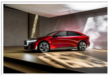
Mazda 6 e.